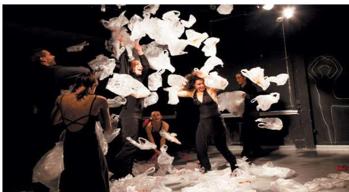
Фрагмент выпускного спектакля в ГСИИ